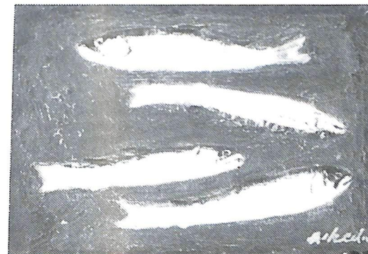
山 女 魚 (昭和46年作) 故池田甚三郎画伯