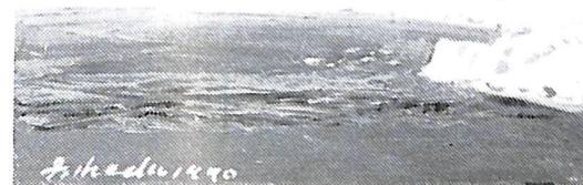
白雪駒岳(昭和45年作)故池田甚三郎画伯