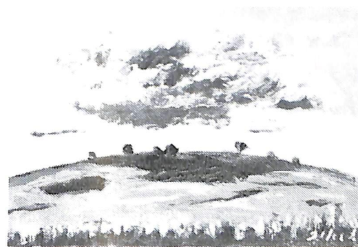
雲 と 高 原 (昭和53年作) 故池田甚三郎画伯