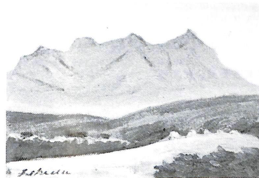
ニ セ コ (昭和57年作) 故池田甚三郎画伯