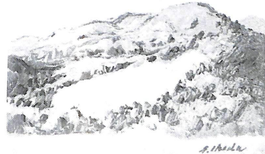
晩 秋（昭和46年作）故池田甚三郎画伯