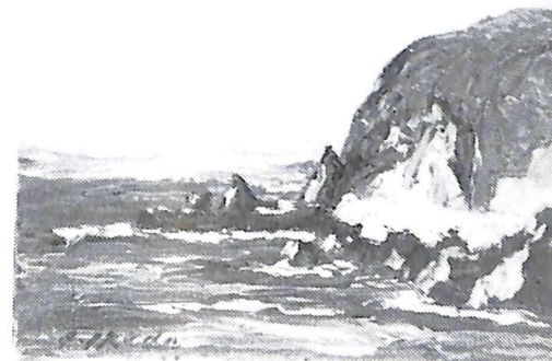
小谷石風景（昭和44年作）故池田甚三郎画伯