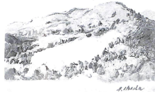
晩 秋（昭和46年作）故池田甚三郎画伯