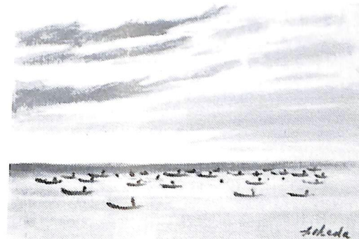
ホッキ採り(昭和50年作)故池田甚三郎画伯