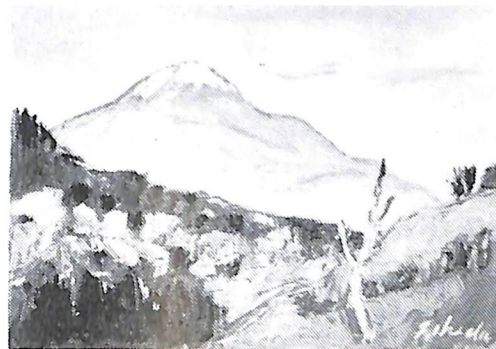
阿寒岳足寄より（昭和56年作）故池田甚三郎画伯