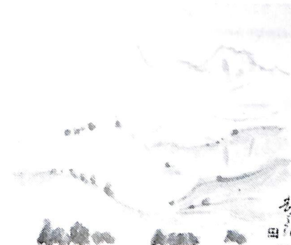
色紙 大雪山(昭和54年作)故池田甚三郎画伯