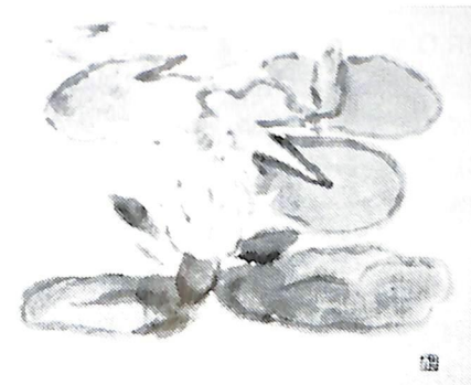
色紙 すいれん（昭和50年作）故池田甚三郎画伯