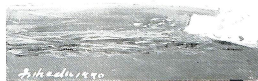
白雪駒岳(昭和45年作)故池田甚三郎画伯