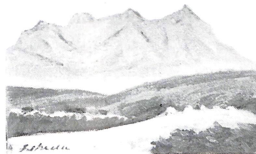
ニセコ(昭和57年作)故池田甚三郎画伯