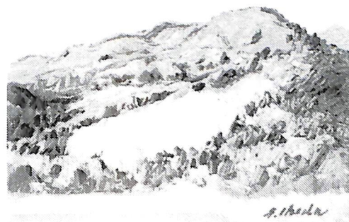
晩 秋（昭和46年作）故池田甚三郎画伯