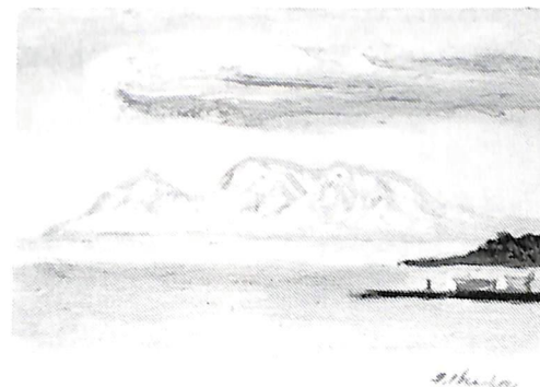
望千軒残雪(昭和55年作)故池田甚三郎画伯