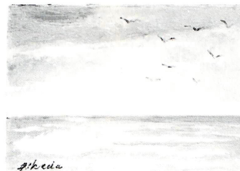
荒 天（昭和52年作）故池田甚三郎画伯