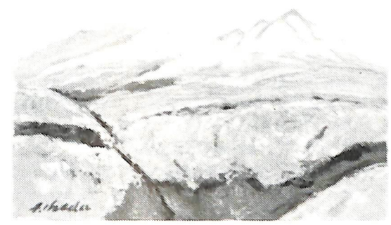
ガンピ山初秋（昭和46年作）故池田甚三郎画伯