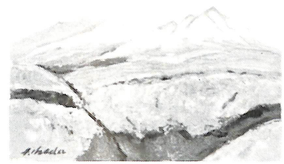
ガンピ山初秋(昭和46年作)故池田甚三郎画伯