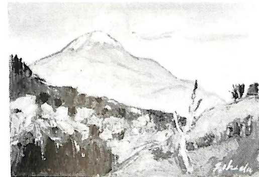
阿寒岳足寄より（昭和56年作）故池田甚三郎画伯