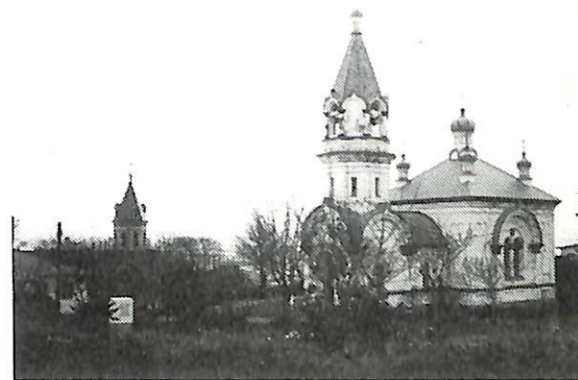
ハリストス正教会