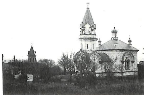
ハリストス正教会