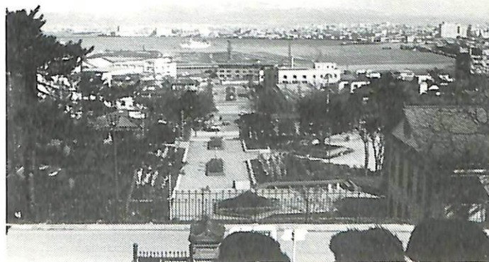
元町から見た函館港