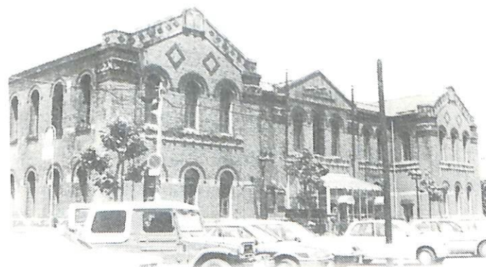
明 治 館