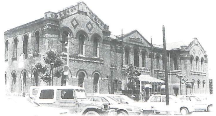
明 治 館