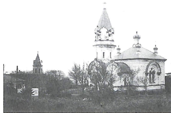
ハリストス正教会