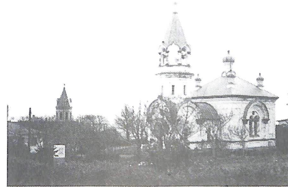
ハリストス正教会