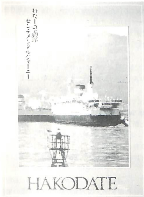
函館市観光ポスター(62年冬)