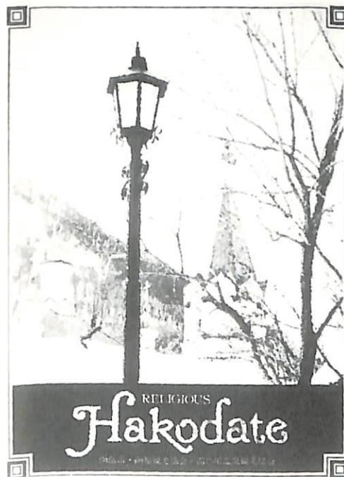
函館市観光ポスター(61年冬)