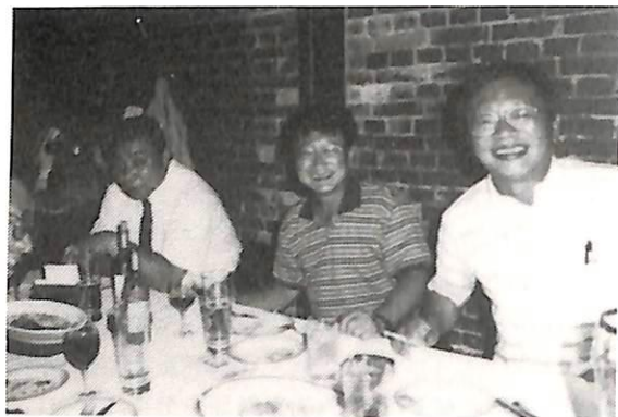
八月八日 納涼家族会