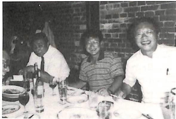
八月八日 納涼家族会