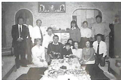
故宮崎会員宅でのホームスティ