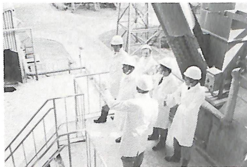
日本セメント(株)上磯工場