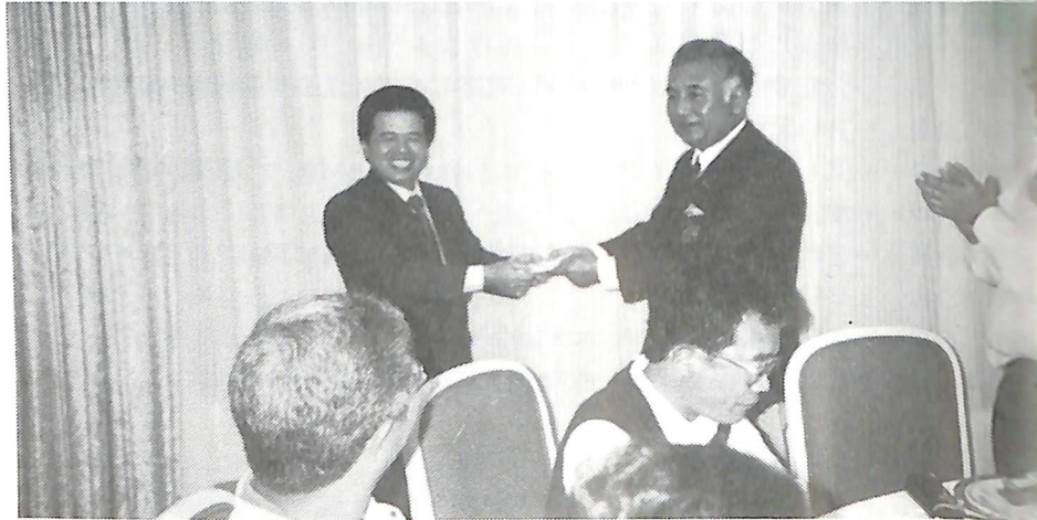
台北東北R.C.表敬訪問 松橋会長よりニコニコBOXへ