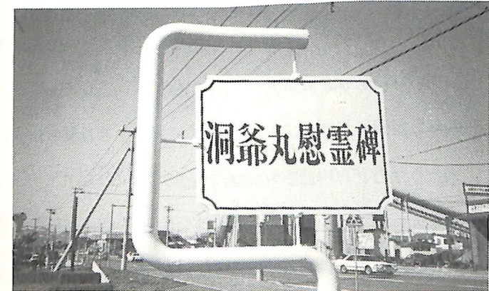
函館北部R.A.C. 創立10周年記念事業 洞爺丸慰霊碑 案内板