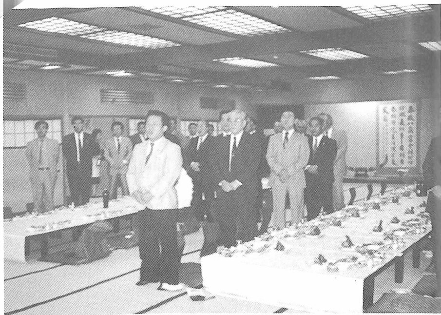
ロータリーソング 齊 唱