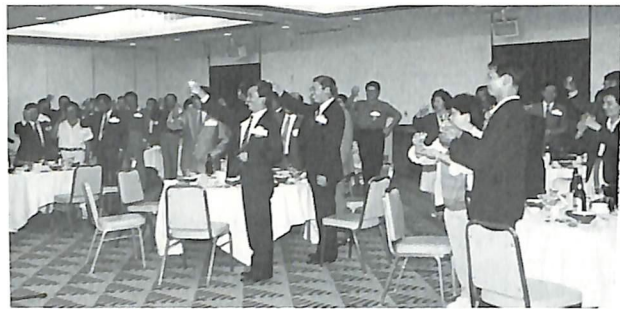
歓迎夕食会で乾杯する両クラブメンバー