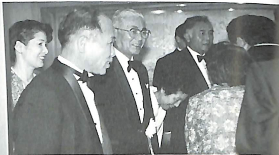
すべてが終り来賓をお見送りする 会長・実行委員長ご夫妻