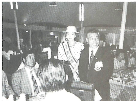
8月24日 移動例会・青函博会場