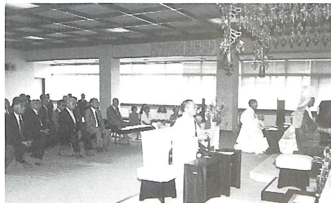
8月10日 25周年記念 物故者追悼法要 於 信照寺