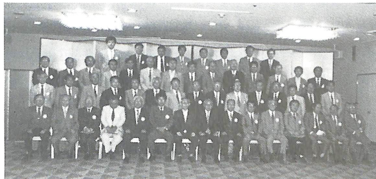
大橋ガバナー公式訪問記念