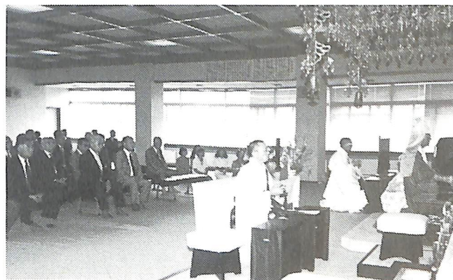
8月10日 25周年記念 物故者追悼法要 於 信照寺