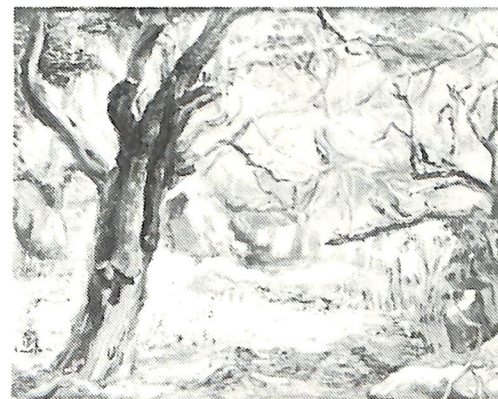
鈴木 巖「静かな朝」制作年不詳 油彩・キャンバス 38.0×46.0