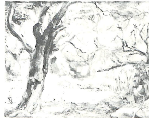
鈴木 巖「静かな朝」制作年不詳 油彩・キャンバス 38.0×46.0