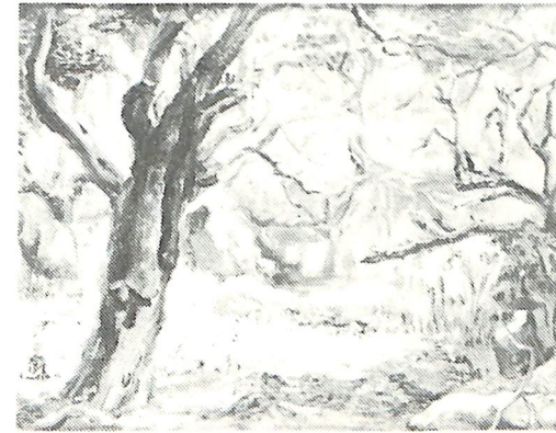
鈴木 巖「静かな朝」制作年不詳 油彩・キャンバス 38.0×46.0