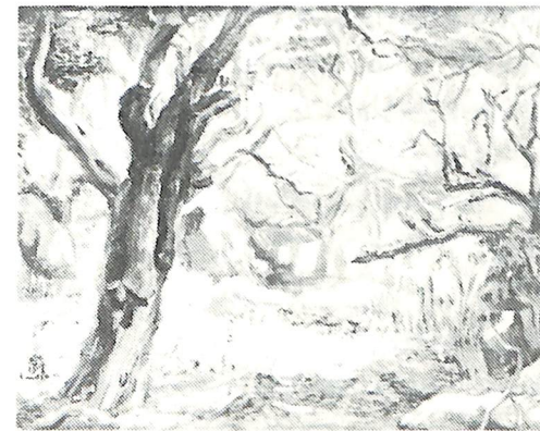
鈴木 巖「静かな朝」制作年不詳 油彩・キャンバス 38.0×46.0