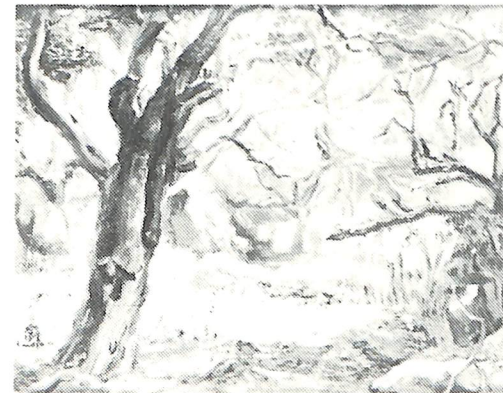
鈴木 巖「静かな朝」制作年不詳 油彩・キャンパス 38.0×46.0