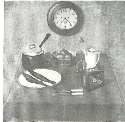
酒谷 小三郎「時計のある静物」制作年不詳 油彩・キャンバス77.7×77.5 北海道立函館美術館蔵