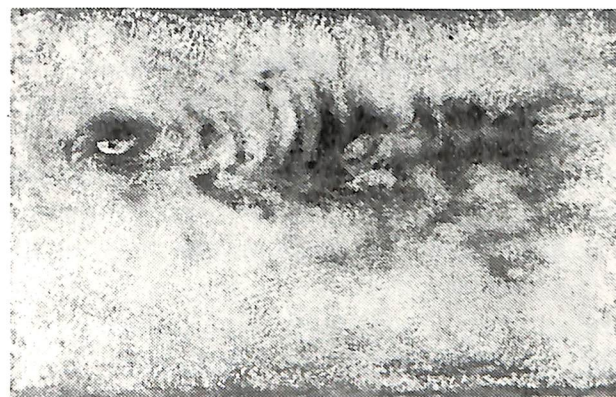
橋本 三郎「飛 翔 ▲A」1960 (昭35) 油彩・キャンバス 129.5×192.0 北海道立函館美術館蔵