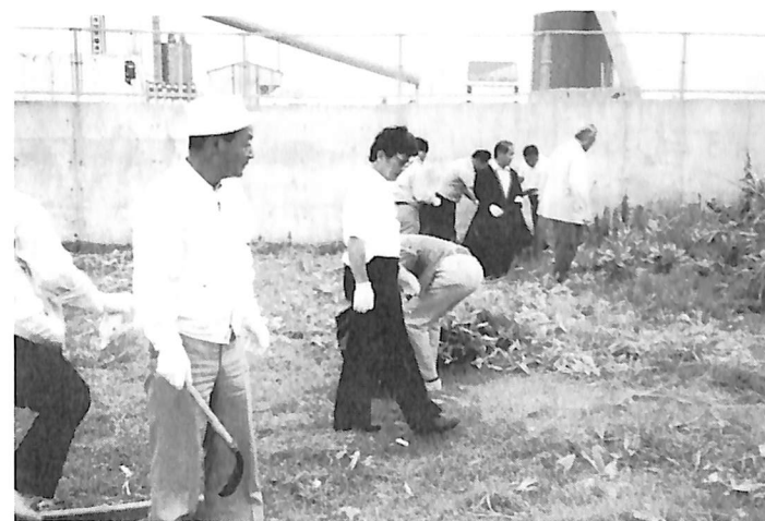
9月16日 早朝例会 洞爺丸慰霊碑清掃