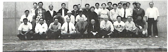
9月16日 早朝例会 洞爺丸慰霊碑清掃