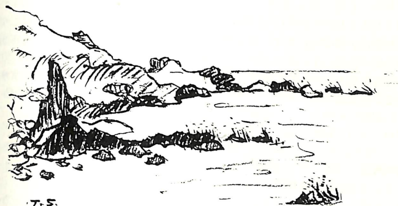
7-5 毘法華の海 椎谷 龍彦 会員