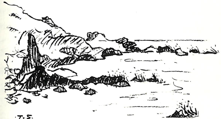
7-5 毘法華の海 椎谷 龍彦 会員