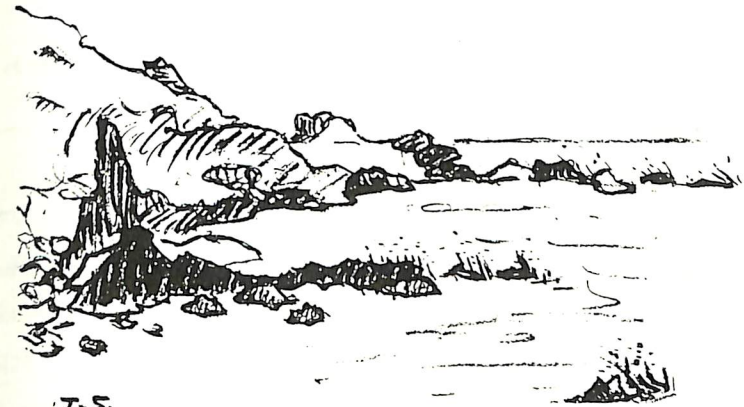
7-5 毬法華の海 椎谷 龍彦 会員