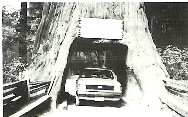
カルフォルニア、レッドウッドパークの紀元前400年前の大樹 現在も生のびています。 沢田鶴造会長 撮影