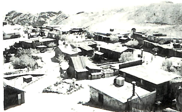
ネバタの砂漠の中にあるゴーストタウン・キャリコ……