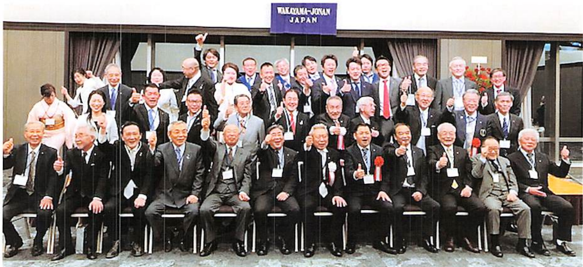
(会報担当者：渡部 二康 委員長)