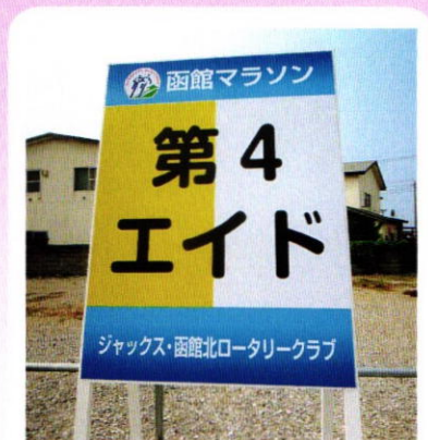
7月2日 函館マラソン

北RCは湯川の第4エイドで「トラピ スチヌ修道院のホワイトチョコレート」 を担当しました。およそ2時間ほどです が会員一同楽しく活動しました。お疲れ 様でした！